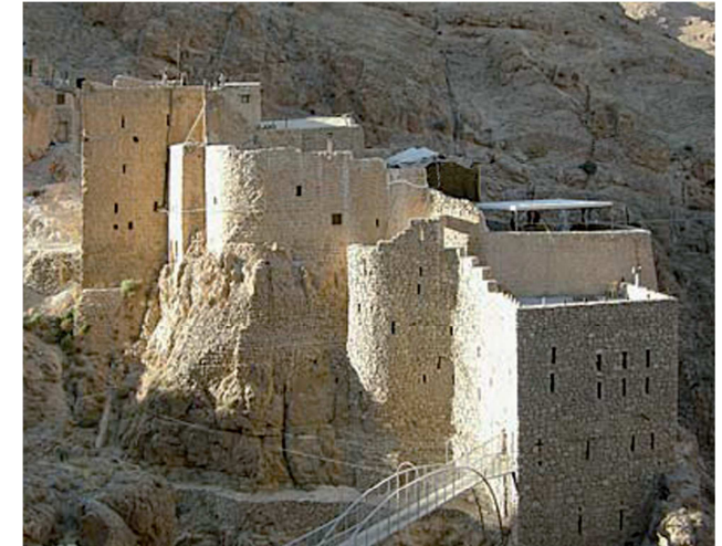
Monastère de Mar Moussa Syrie

ASSOCIATION LES AMIS DE MAR MOUSSA FRANCE